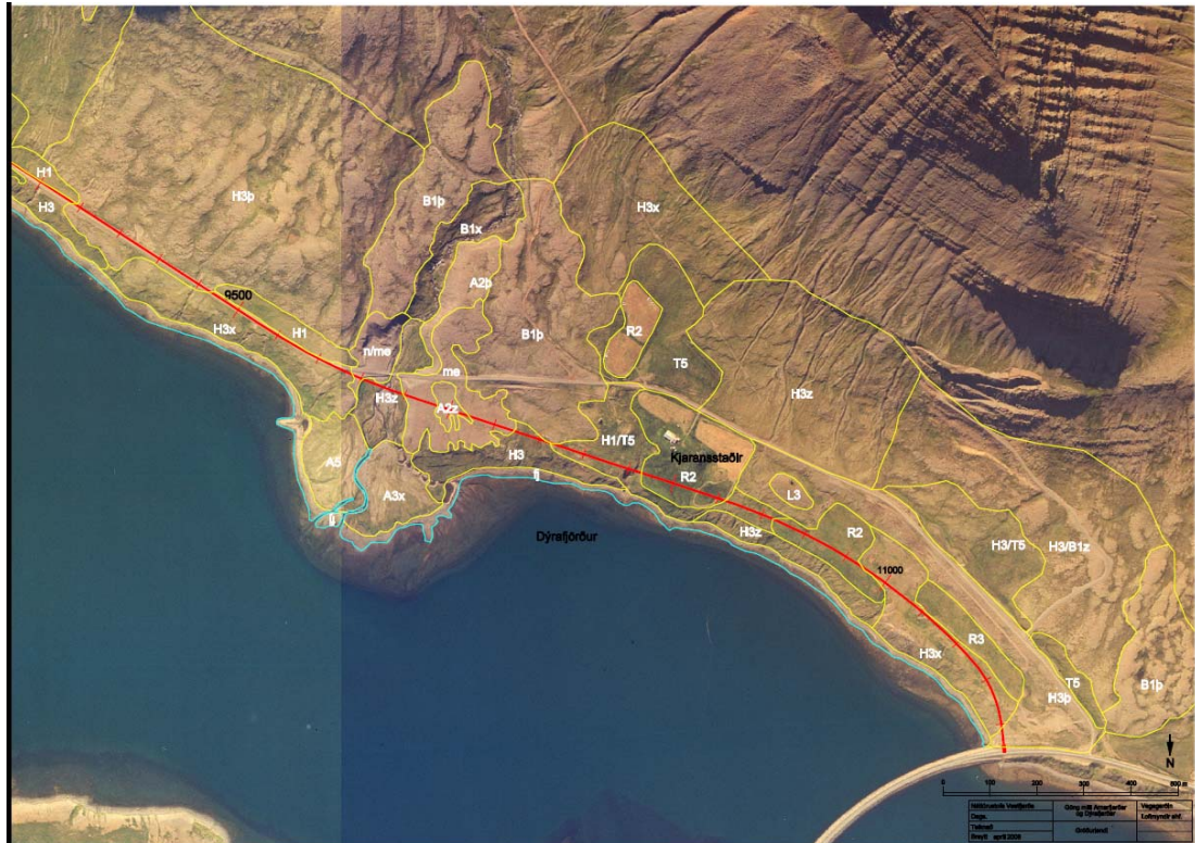
Mynd 6. Kjaransstaðir. Skýringar sjá töflu 1.

Fyrir ofan veg eru skriðurunnar lyngbrekkur (B1). Fyrir neðan veg er graslendi með vallarsveifgrasi, bugðupunti og ilmrey (H3 og H1). Smá votlendi má finna með klóffu, mýrarstörom (U4) og hálfdeigju (T5).