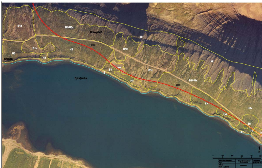
Mynd 5. Drangahlíð. Flokkunarkerfi Náttúrufræðistofnunar. Skýringar sjá töflu 1.

Við flokkun á gróðri var stuðst við flokkunarkerfi Náttúrufræðistofnunar frá því í júlí 1997. Gróðurlendi voru afmörkuð á loftmyndum (Loftmyndir ehf).