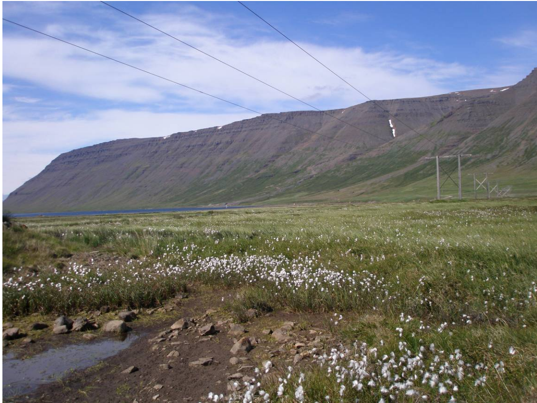
Mynd 4. Mýrarflói fyrir ofan veg í Borgarfirði