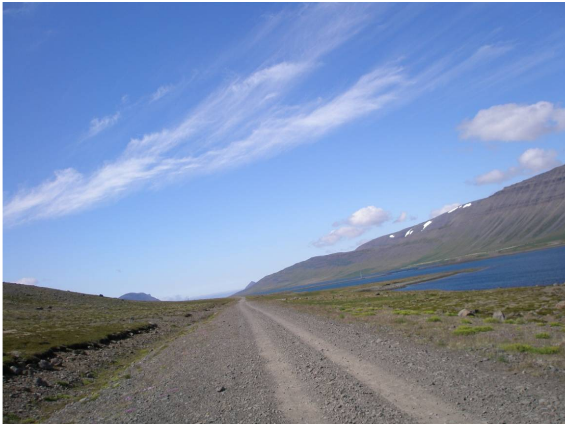
Mynd 2. Séð út Drangahlíð

Gróðurkönnun var gerð í þurru og sólríku veðri. Gengið var upp hlíðina að ætluðum gangamunna, síðan var gengið fyrir neðan núverandi veg í átt að Kjaransstöðum. Vegur að jarðgöngum Dýrafjarðarmegin fylgir núverandi veglínu vegar sem liggur að botni Dýrafjarðar. Veglínan inn Drangahlíð liggur aðeins neðan við núverandi veglínu nær sjávarbakkanum. Gangamunninn kemur síðan við Bæjarhvilft við Dranga. Við gangamunnann er að finna skriðurunnar lyngbrekkur með bláberjalyngi og aðalbláberjalyngi fyrir ofan veg. Fyrir neðan veg er graslendi með vallarsveifgrasi, bugðupunti og ilmrey (mynd 2). Einnig er þar smá votlendi með klófífu og mýrarstör (mynd 5). Í kringum Kjaransstaði er fjölbreyttari gróður. Þar er graslendi með bugðupunti, ilmrey og hærur og melar með mosa og krækilyngi. Einnig eru þar gömul tún með túnvingli. Þar sem er blautara í graslendinu er klófífa og starir þ.e. gulstör og mýrarstör. Einnig eru þarna tún með túnvingli, ljónslappa og súrum ásamt graslendi með mosa, vallarsveifgrasi og hærur. Lyngbrekkur eru með aðalbláberjalyngi og bláberjalyngi. Frá Kjaransstöðum til Dýrafjarðarbrúar eru melar og gömul tún með melagróðri á milli. Þar er einnig skriðurunninn melur með bugðupunkti. Lúpína er í kringum grafreit og þar er eitt grenitré (mynd 6).