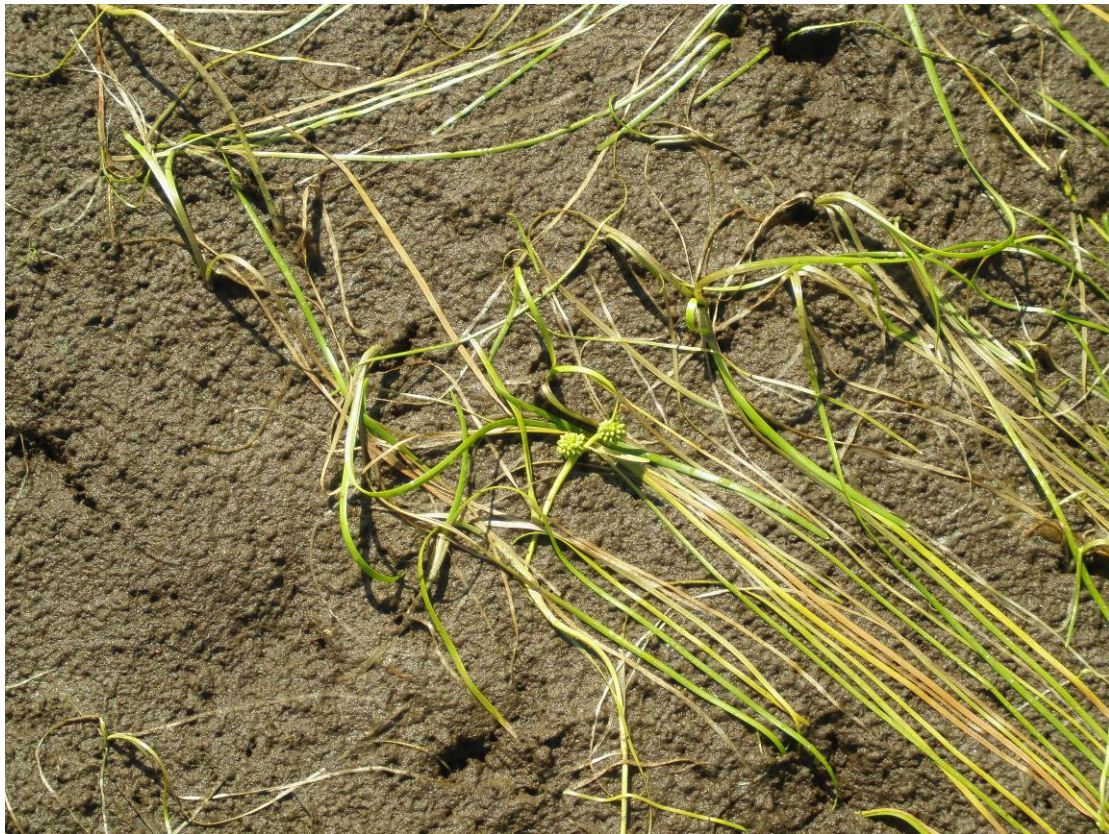
Mynd 3. Mógrafarbrúsi í blóma í Borgarfirði.

Gróðurkönnun var gerð í þurru og sólríku veðri. Gengið var frá Mjólká og yfir að Rauðsstöðum upp að ætluðum gangamunna. Arnarfjarðarmegin kemur gangnamunninn út stutt frá eyðibýlinu Rauðsstöðum, þar sem eru skriðurunnar þurrar brekkur með bugðupunti og lyngi. Landið er töluvert blautt en mest áberandi er lyngmói. með bugðupunti, bláberjalyngi, aðalbláberjalyngi, krækilyngi og fjalldrapa. Neðar er mýrlendi með bugðupunti, bláberjalyngi, aðalbláberjalyngi, krækilyngi og fjalldrapa. Graslendi eru þar inn á milli. Nýr vegur fylgir núverandi veglínu að Hofsá. Hallamýri er í hlíðinni við Rauðsstaði sem hefur verið ræst fram að hluta og þar er bæði beutiland og tún. Í framræstu stykkjunum er vallarsveifgras, túnsúru, reyrgresi og túnvingull. Tvö áborin tún eru með vallarfoxgrasi, túnsúru og mýrarstör. Meðfram veginum eru klófífa og starir, tjarnarstör eru í skurði og reyrgresi fyrir neðan veg. Við Hofsá eru móar og melar með fjalldrapa, bugðupunti og bláberjalyngi (mynd 7).