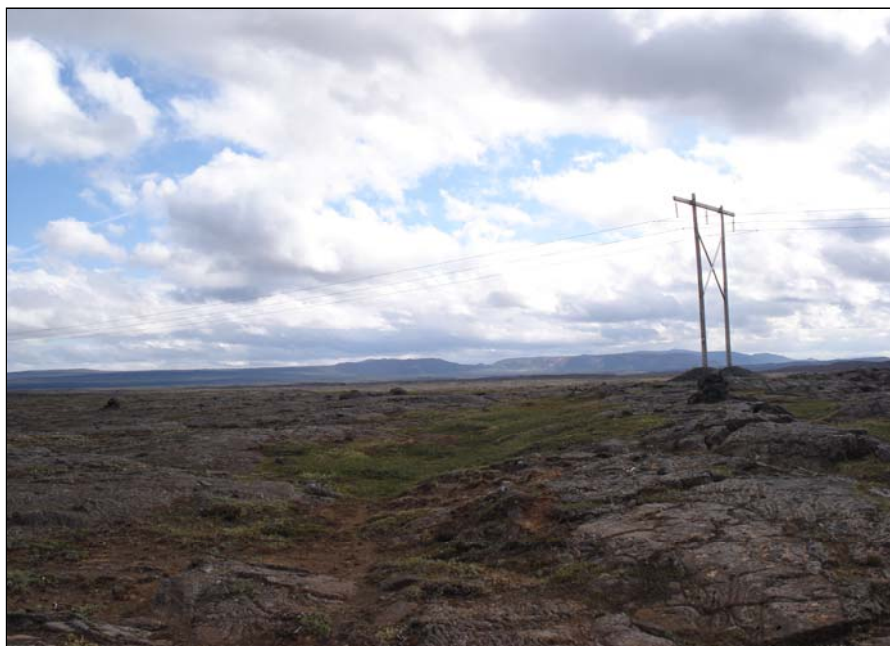
TVÆR VÖRDUR, HORFT TIL S

Fast sunnan við núverandi veg og um 370 austan við fyrirhugað vegarstæði er varða. Helluhraunsholt.