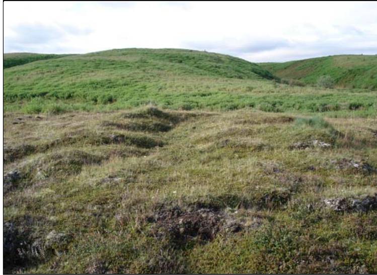
TÓFT, HORFT TIL S

Nokkrum metrum norðan við fyrirhugað vegarstæði er fornleg tóft.