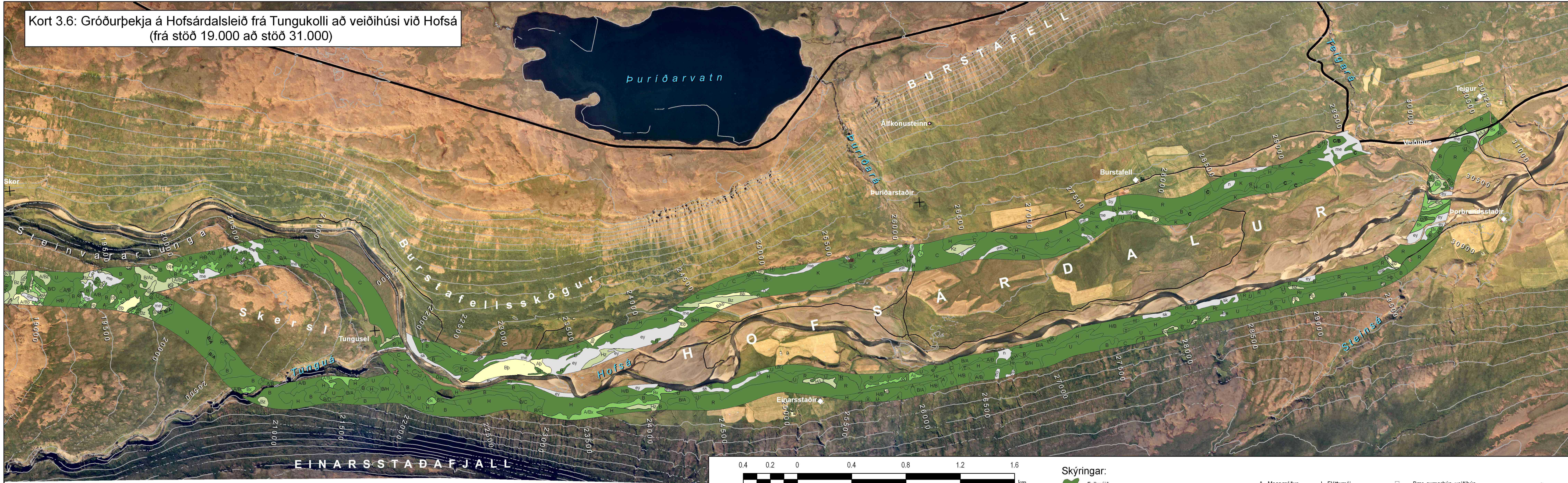
Kort 3.6: Gróðurpekja á Hofsdalsleið frá Tungukolli að veiðihúsi við Hofsa (frá stöð 19.000 að stöð 31.000)