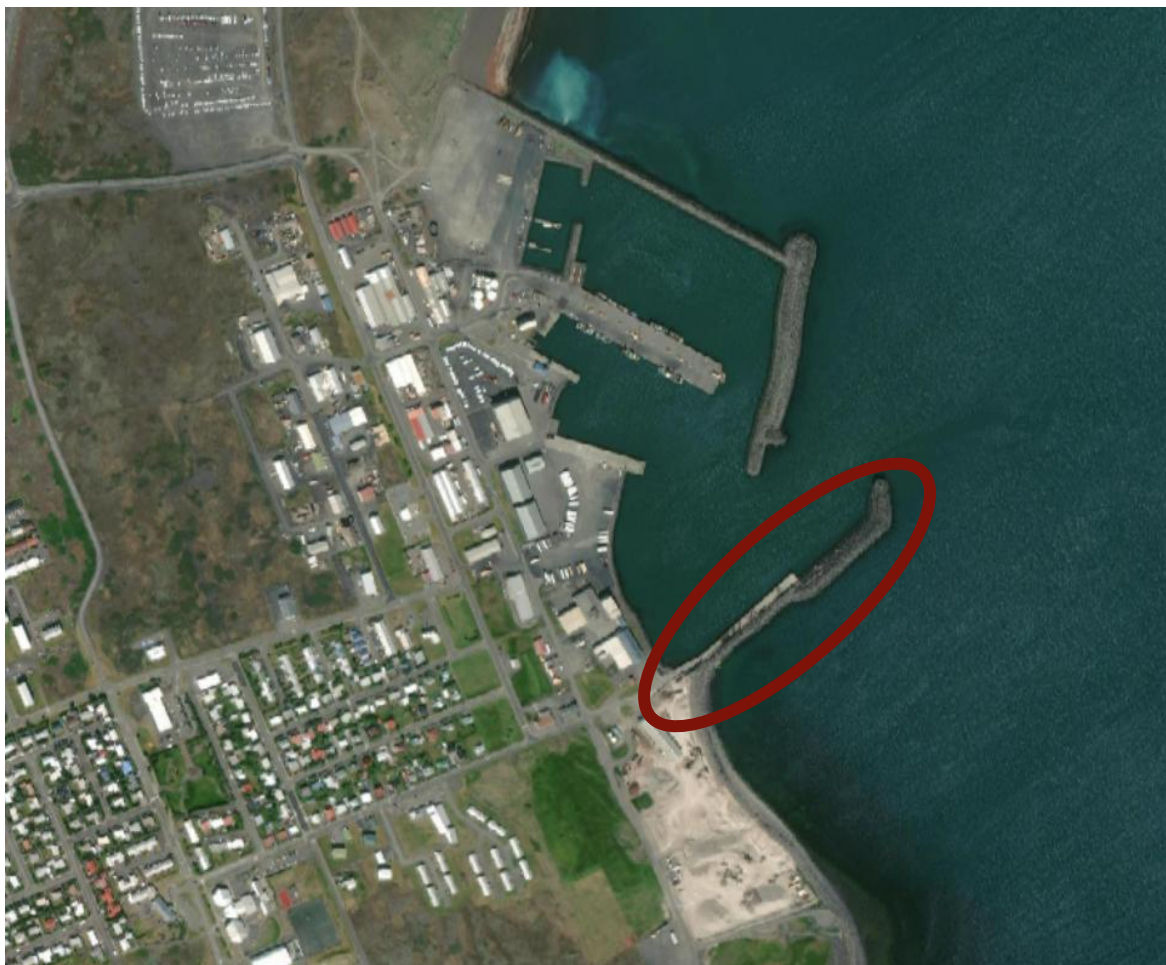
MYND 1.1 Yfirlitsmynd af hafnarsvæðinu í Þorlákshöfn. Suðurvararbryggja og Suðurvarargarður, sem fyrirhugað er að breyta, eru rauðmerkt.

Heildarstærð svæðisins sem framkvæmdirnar ná til er um 4,5 ha og er grjótmagn sem fer í varnargarða áætlað um 135.000 m 3 , þar af verður hægt að endurnýta um 70.000 m 3 úr núverandi varnargarði. Það sem á vantar kemur frá framkvæmdum á fiskeldislóð í nágrenninu en þegar hefur farið fram umhverfismat fyrir framkvæmdum á þeirri lóð.