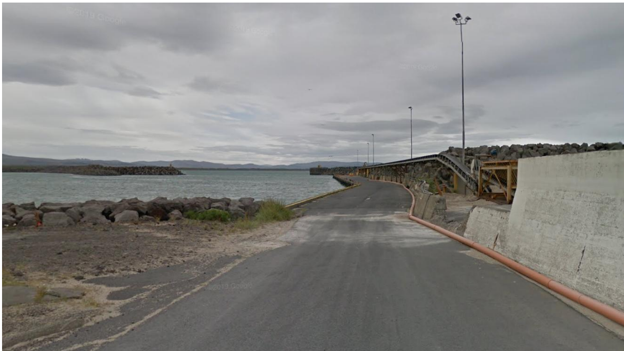
MYND 2.1 Núverandi aðstæður á Suðurvararbryggju. Suðurvaragarður í bakgrunni.

Líkt og áður segir hefur verið mikil aukning á vöruflutningum um höfnina síðari ár og eiga stærri skip erfitt með að athafna sig innan núverandi hafnar. Með því að landa í Þorlákshöfn í staðinn fyrir að fara fyrir Reykjanesið geta flutningaskip sparað sér um sólarring í siglingu með tilheyrandi tímasparnaði, auknu öryggi, styttri siglingaleið, olíusparnaði og minni útblæstri. Fyrirhugaðar framkvæmdir munu auðvelda móttöku stærri skipa og gera öll umsvif og athafnir auðveldari og öruggari, bæði á sjó og landi.